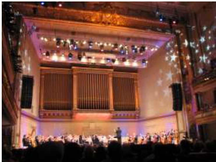
Boston Pops Orkester med Keith Lockhart, dirigent LEROY ANDERSON TRIBUT Symphony Hall Boston Massachusetts - 5 juni 2008

Leroy Anderson Band Center Harvard University Cambridge, Massachusetts Songwriters Hall of Fame Hollywood Walk of Fame