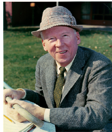
Leroy Anderson (1908-1975) i hemmet i Woodbury, Connecticut