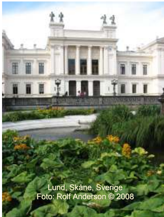
Lund, Skåne, Sverige