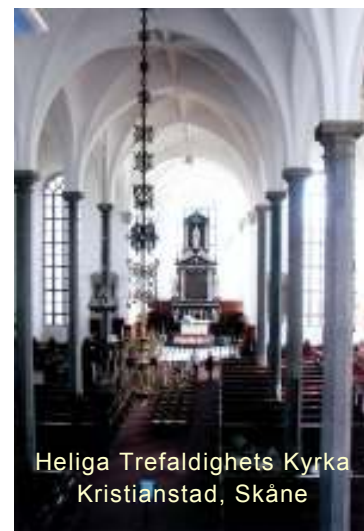
Heliga Trefaldighets Kyrka Kristianstad, Skåne