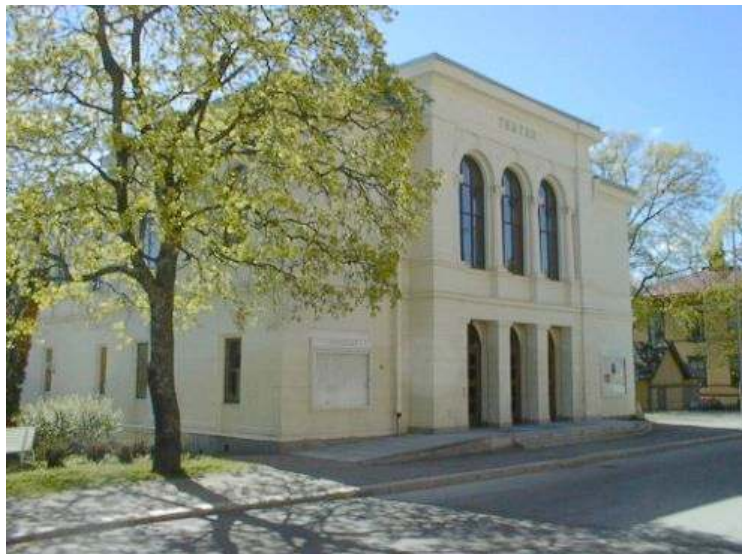
Söderhamns Teater, Sverige