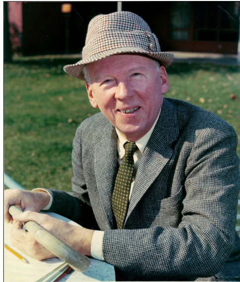
Leroy Anderson (1908-1975) i hemmet i Woodbury, Connecticut

På veckans CD dirigerar Leonard Slatkin en lång rad typiska Andersonkompositioner, men också tonsättarens Pianokonsert C-dur. Leroy Anderson drog tillbaka pianokonserten, men efter hans död 1975 har hans släktingar släppt den fri.