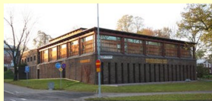
Utvandrarnas Hus Växjö, Kronoberg, Småland SVERIGE

Anderson erkände under sina sista år att musiken han komponerat fått en egen identitet och popularitet som överträffade hans egen berömmelse som kompositör. Vid det tillfället hade han antagligen rätt. Under senare år har emellertid medvetenheten om Leroy Anderson dramatiskt ökat. Det beror på nya inspelningar av hans musik, nyutgivningar av Andersons originalinspelningar på CD, många konserter då hans verk uppförs, ett SVT/PBS TV-program om honom med miljoner tittare som PBS sedan 1999 sänder årligen i USA, en bok om kompositören, samt där officiella hemsida: leroyanderson.com och leroyandersonfoundation.org .