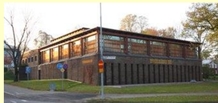
Utvandrarnas Hus Växjö, Kronoberg, Småland SVERIGE

Anderson erkände under sina sista år att musiken han komponerat fått en egen identitet och popularitet som överträffade hans egen berömmelse som kompositör. Vid det tillfället hade han antagligen rätt. Under senare år har emellertid medvetenheten om Leroy Anderson dramatiskt ökat. Det beror på nya inspelningar av hans musik, nyutgivningar av Andersons originalinspelningar på CD, många konserter då hans verk uppförs, ett SVT/PBS TV-program om honom med miljoner tittare som PBS sedan 1999 sänder årligen i USA, en bok om kompositören, samt där officiella hemsida: leroyanderson.com och leroyandersonfoundation.org .